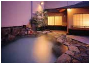
4 紀州・白浜温泉 おさし 「楽湯」※現在「湯めぐり」休止中 パンダシール 2枚 Tel.0739-43-0634