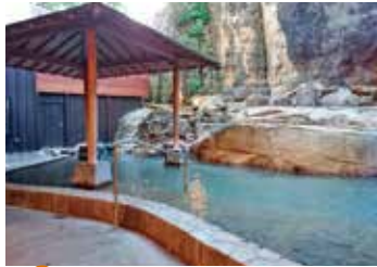
2 湯快リゾートプレミアム 白浜彩朝楽 「彩の湯」「朝の湯」 パンダシール 2枚 Tel.0570-550-078