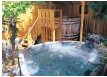
6 HOTEL SHIRAHAMAKAN(白浜館) 「柿乃葉の湯露天風呂」 パンダシール 2枚 Tel.0739-43-5151