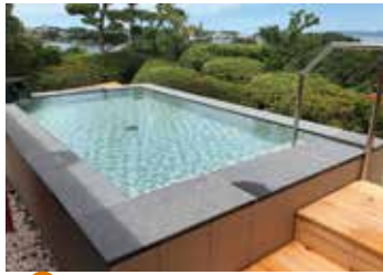
1 ホテルサンルート白浜 「大浴場」 パンダシール 2枚 Tel.0739-82-2391

施設により、ご利用可能時間や休館日などが異なりますので、詳しくはお問い合わせください。