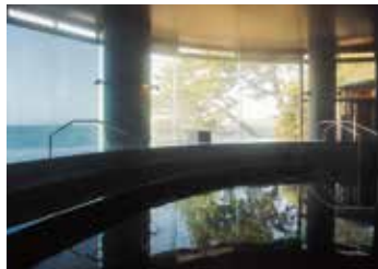
9 SHIRAHAMA KEY TERRACE ホテルシーモア 「大浴場 海の湯」 パンダシール 2枚 Tel.0739-43-1000