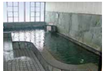
C 白良湯 パンダシール 1枚 Tel.0739-43-2614