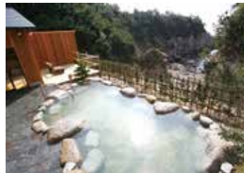
11 湯快リゾートプレミアム ホテル千畳 「千寿の湯」 パンダシール 2枚 Tel.0570-550-078