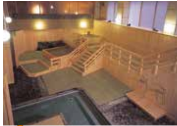
8 ホテル 三楽荘 「夕月」「宵街」 パンダシール 2枚 Tel.0739-43-1111