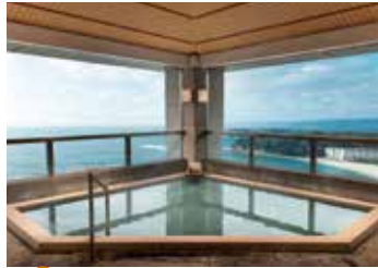
7 南紀白浜 マリオットホテル 「展望露天風呂」 パンダシール 2枚 Tel.0739-43-2600