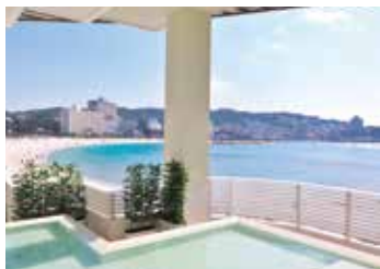
5 白良荘グランドホテル 「松風」「潮風」 パンダシール 2枚 Tel.0739-43-0100