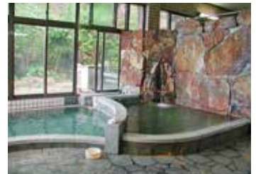
B 牟婁の湯 パンダシール 1枚 Tel.0739-43-0686