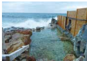
A 崎の湯 露天風呂 パンダシール 1枚 Tel.0739-42-3016